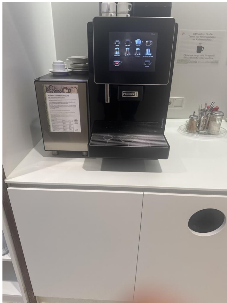
Abbildung 6: Kaffeeautomat mit seitlich angebautem Milchkühler