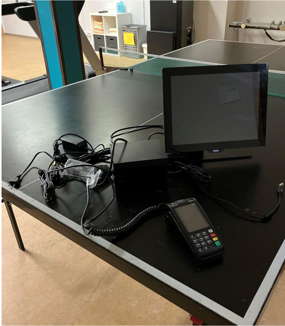
Abbildung 3: Eingelagertes Reserve-Kassensystem mit Zahlungsterminal