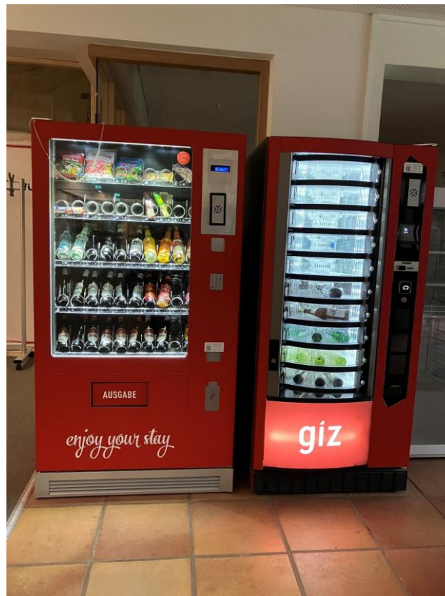
Abbildung 8: Drei kombinierte Snack- und Getränkeautomaten – Aufstellungssituation