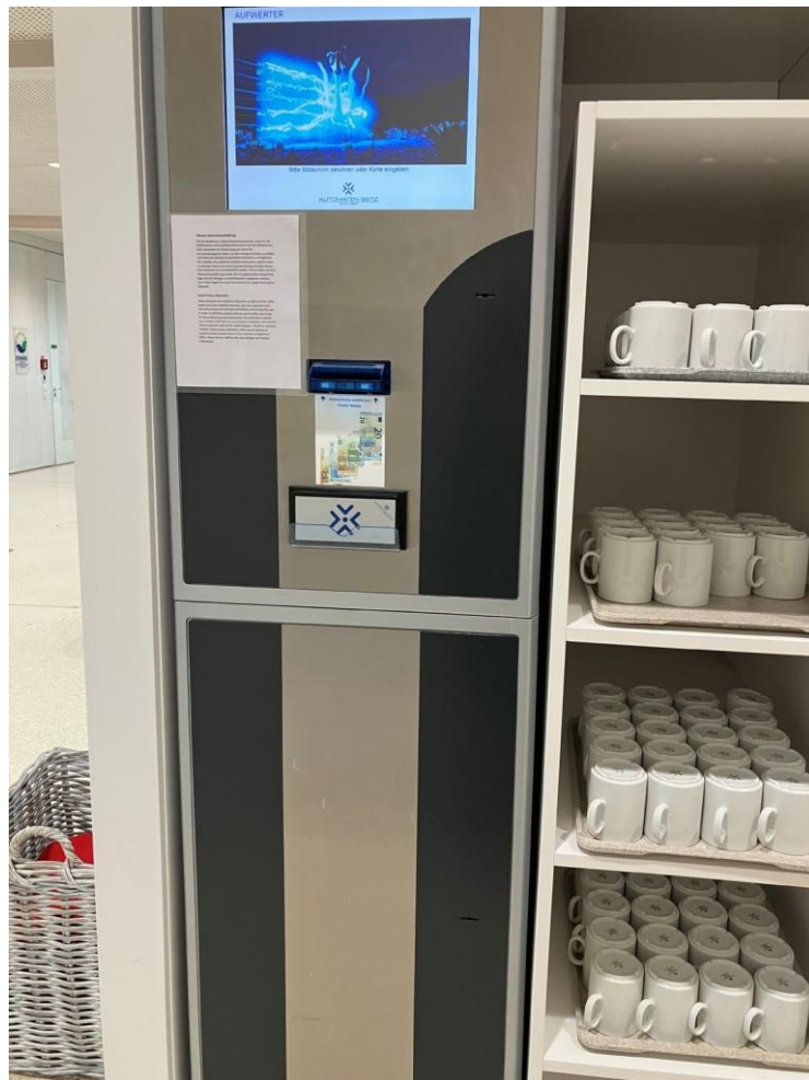
Abbildung 4: Aufwerter Restaurant (Haus 1)