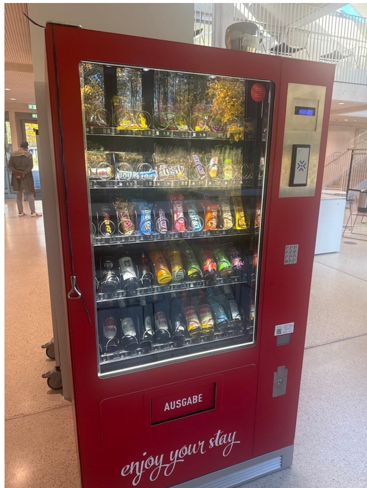
Abbildung 9: Snack- und Getränkeautomat – Frontalansicht mit Bedienleiste und Bezahl-Terminal