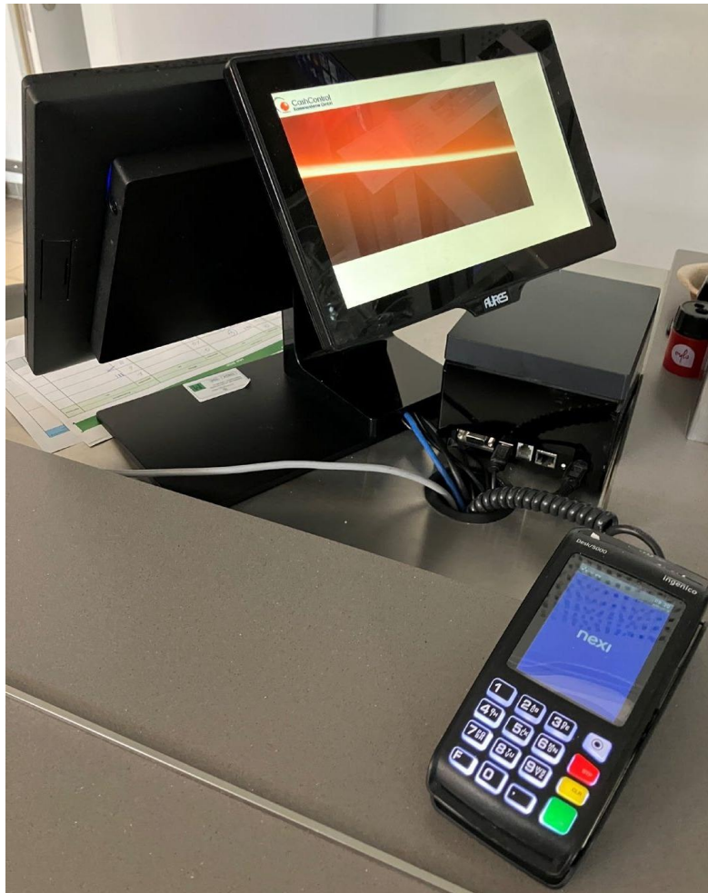
Abbildung 2: Kassensarbeitsplatz Restaurant – Detailansicht mit Touch-Display und Zahlungsterminal