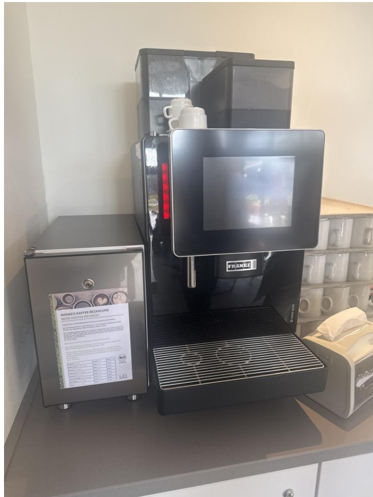
Abbildung 7: Weiterer Kaffeeautomat (Haus 2)