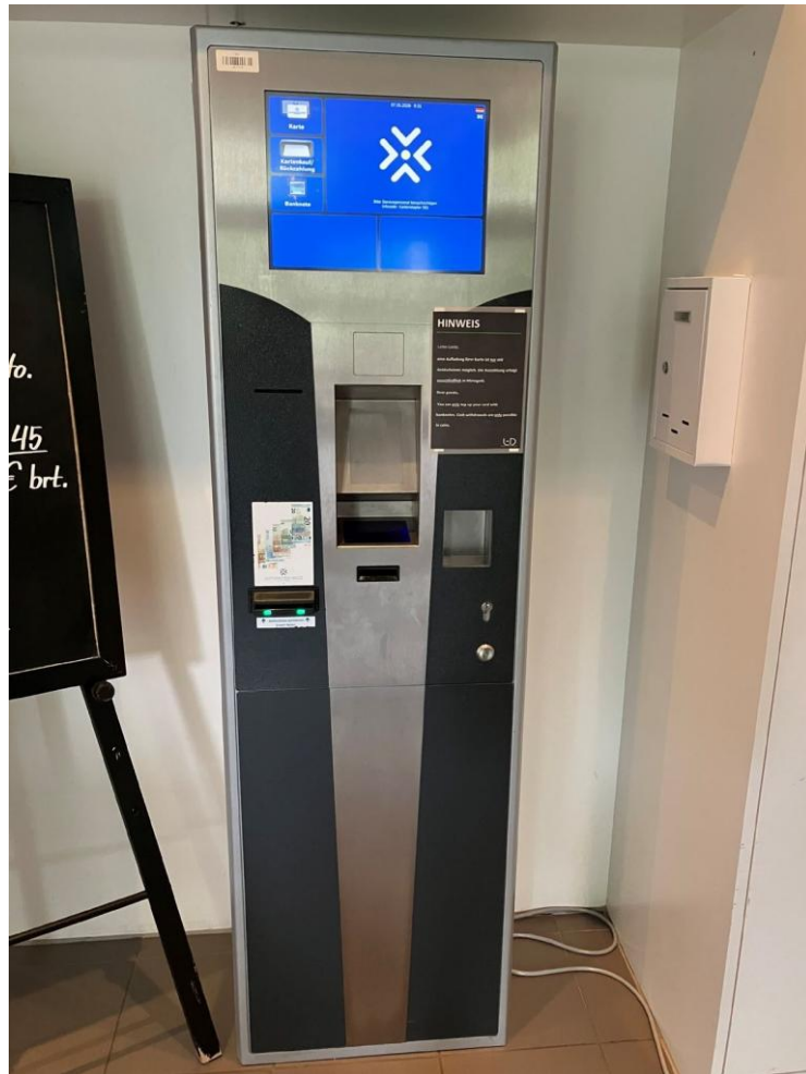
Abbildung 5: Aufwerter Seminargebäude (Haus 2)